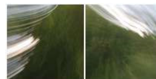
Pulsations 34, Pulsations 35 - degoy.net