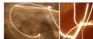
Filaments 5, Filaments 14 - degoy.net