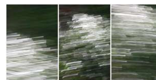
Innerwaters 15, Innerwaters 11, Innerwaters 18 - degoy.net